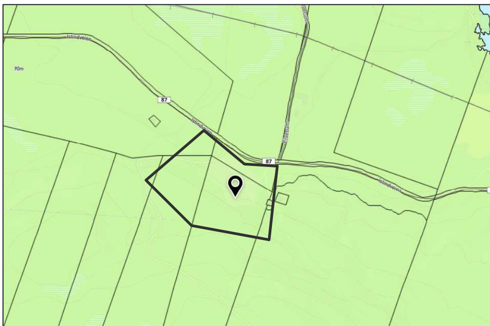
Figur 2: Planstatus. Omtrentlig planområdet er markert med svart strek.

Planområdet ligger langs Istindveien og på vestsiden et stykke unna Kirkeselva og er en del av gnr./bnr. 47/5 og 47/1. Gjeldende plan for området er Plan-ID 5418_2012KPLAN Kommuneplanens arealdel, vedtatt 13.12.2012. I denne planen er aktuelt område avsatt til LNFR.